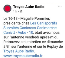
On élargit notre rayonnement local