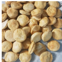
Une recette qui a du Wouf!