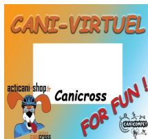
La course virtuelle du mois