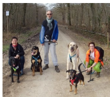
Nos sorties Canimarche ont la côte