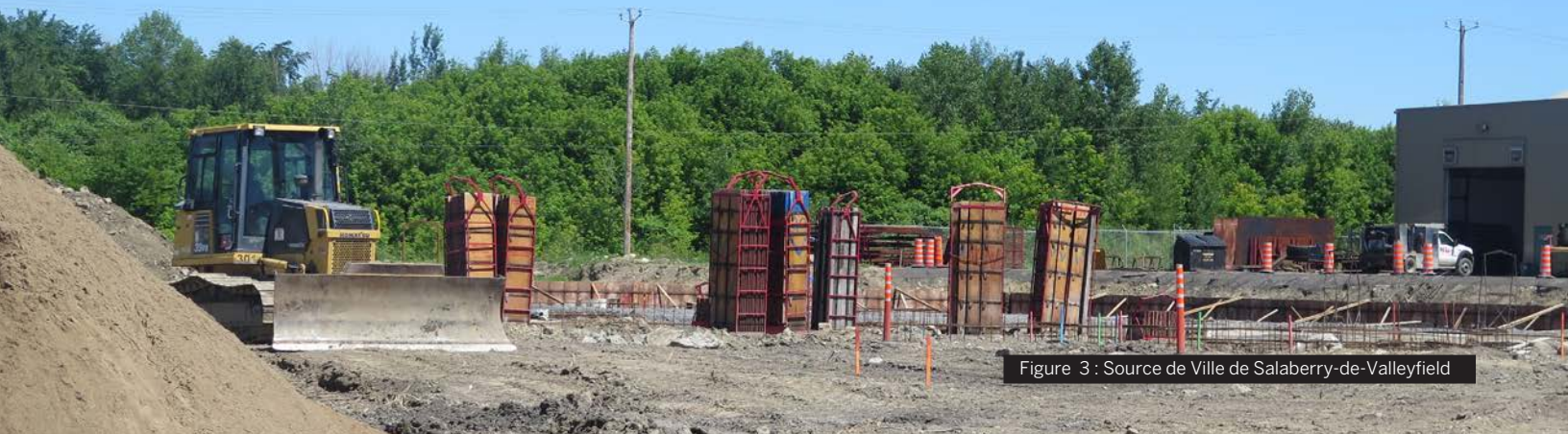
Figure 3 : Source de Ville de Salaberry-de-Valleyfield