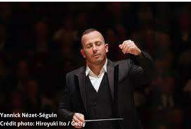
Yannick Nézet-Séguin