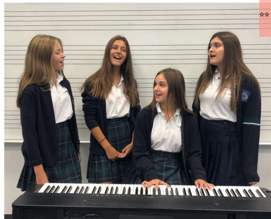
Ensemble vocal de l'Académie de Lafontaine

** International Verona Choral Competition