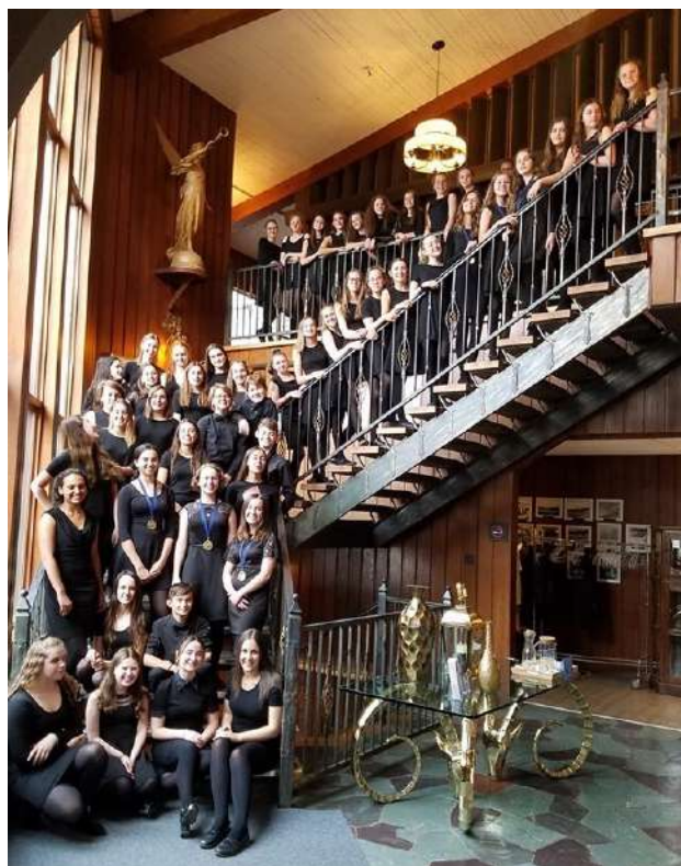
Ensemble vocal de l'Académie Lafontaine

le chœur au piano, une attention bien appréciée des juges, précise M. LeBlanc. « Les gens rient de nous lorsque nous entrons en scène », affirme-t-il, devant la jeunesse des choristes de l'Académie, entre 12 et 17 ans, alors que l'âge des participants se situe généralement entre 17 et 24 ans et que les pianistes sont généralement des professionnels.