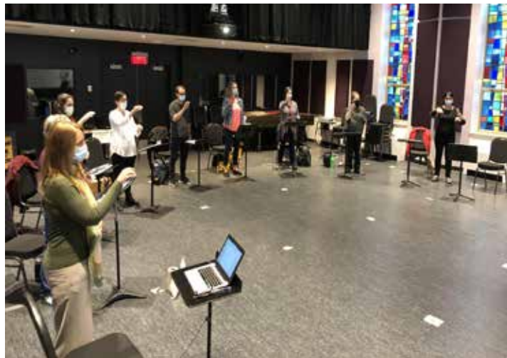
Pendant une formation à la Faculté de musique de l'Université de Montréal

L'année scolaire 2021-2022 s'est déroulée sous le signe de la covid, et les restrictions et fermetures occasionnées ont été autant de bâtons dans les roues pour le développement des projets artistiques et parascolaires dans les écoles. C'est pourquoi nous avons dû attendre au début février 2022 pour le démarrage de chorales dans deux écoles montréalaises : l'école Merton et l'école Sainte-Catherine-de-Sienne.