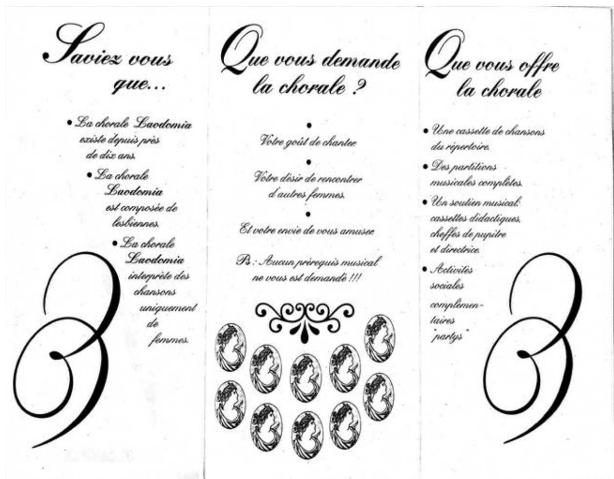
Dépliant de recrutement de la chorale Laodamia