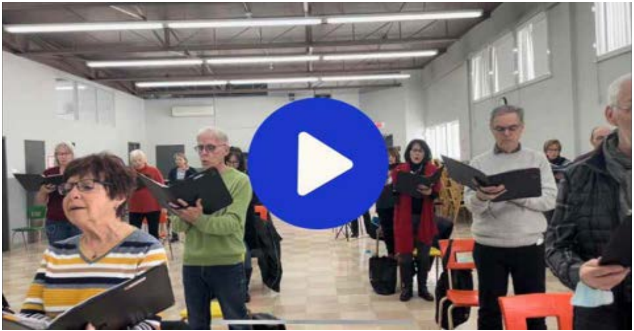
Le Choeur Dal Segno, dans un reportage paru sur Le Fil, sur Noovo Capture d'écran

Également, avec le groupe Mosaïque, nous avons enregistré en français et en anglais le refrain de la chanson « Stop the war » pour aussi amasser des fonds pour les réfugiés ukrainiens. Vous pouvez découvrir cette chanson en cliquant ici .