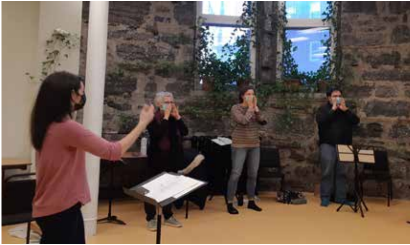
Une formation a eu lieu cet automne à Coopérative des professeurs de musique de Montréal.