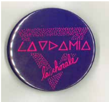
Macaron de la chorale Laodamia

fonds plusieurs documents attestant de cette pratique, dont des programmes de spectacles, des affiches de concerts, des partitions