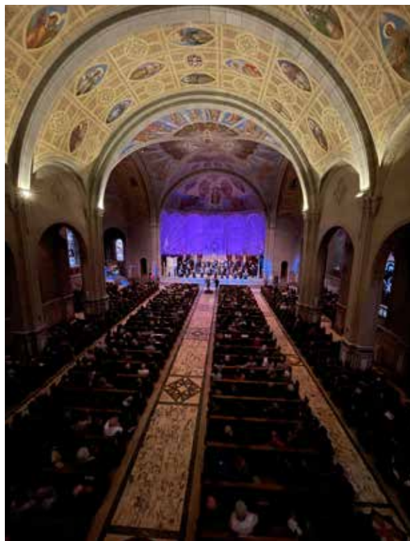
L'église Saint-Léon de Westmount

C'est pourquoi la mise en contexte écrite par le chef de chœur Andrew Gray est importante : « Nous avons commencé à planifier le concert de ce soir il y a longtemps, bien avant que les forces armées de l'actuel régime russe n'envahissent l'Ukraine. Mais par le choix d'un répertoire issu des traditions musicales de cette région du monde, historiquement opprimée et déchirée par la guerre, notre concert se veut un appel à l'unité et à la paix. Nous le présentons dans un esprit de dignité et