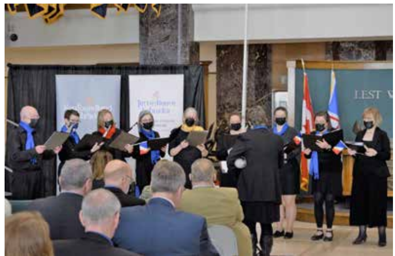
La Rose des vents