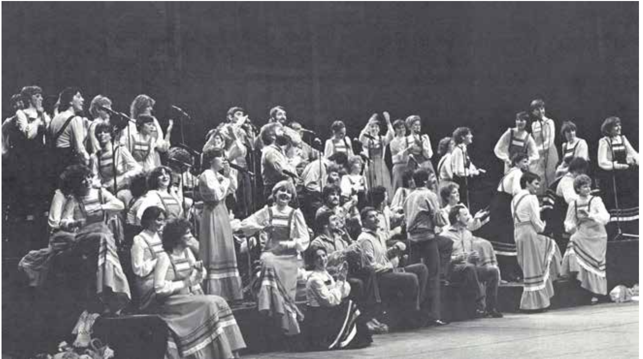
V'là l'Bon vent au Colisée de Québec le 29 octobre 1983. Photo tirée du livre « V'LA L'BON VENT unique, innovateur, en constante évolution 1958-1983 ».

Je vous relate ici mon expérience de ce que j'y ai vu, connu et entendu. La Troupe a évolué autrement par la suite. Aujourd'hui, V'là l'Bon Vent demeure toujours active et au goût du jour.