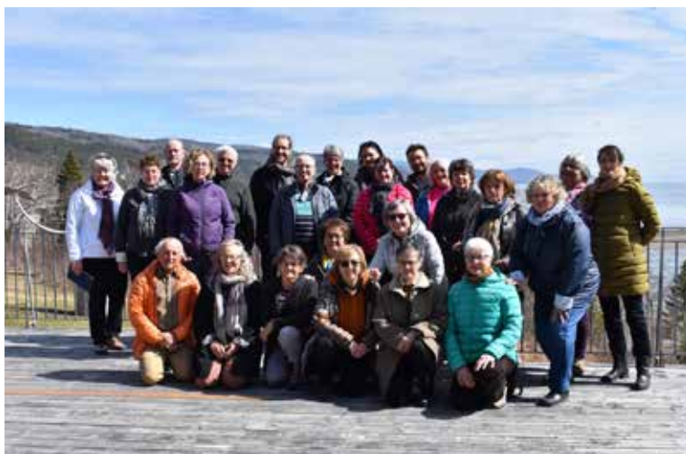
Le Choeur polyphonique de Lévis au Domaine Forget

En plus de profiter de l'enseignement varié de leur chef, les membres ont eu le plaisir de se côtoyer de plus près et de se retrouver dans une atmosphère détendue, chaleureuse et festive. Ce fut l'occasion pour eux de renouer avec l'essentiel : partager une même passion pour le chant, fraterniser et grandir au contact de personnes riches de coeur et de talents. La splendeur du paysage, la lumière sur le vaste fleuve, les rires et le partage d'émotions se sont alliés à un florilège de chants sacrés et d'harmonies vocales. Tout cela a été bon et magique, stimulant et vivifiant, un vrai bonheur pour choristes reconnaissants!