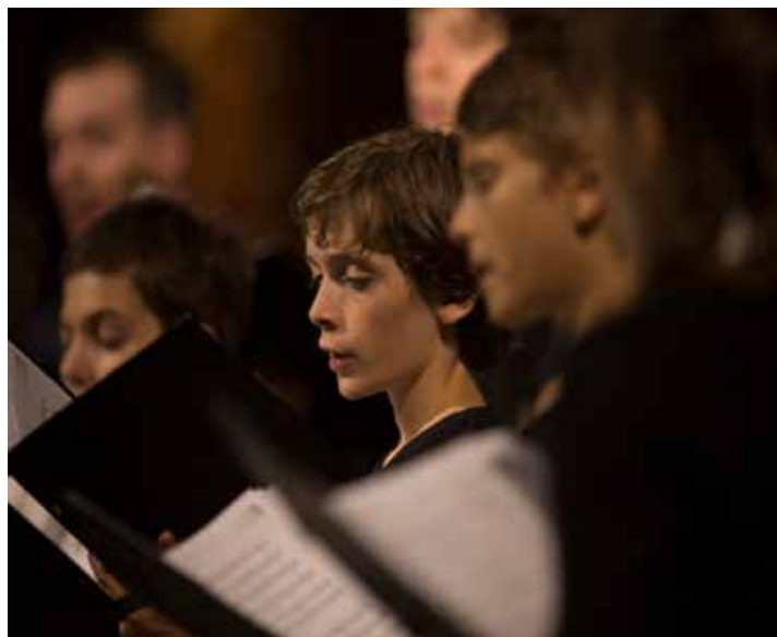
Le Chœur d'enfants de la Maîtrise Notre-Dame de Paris