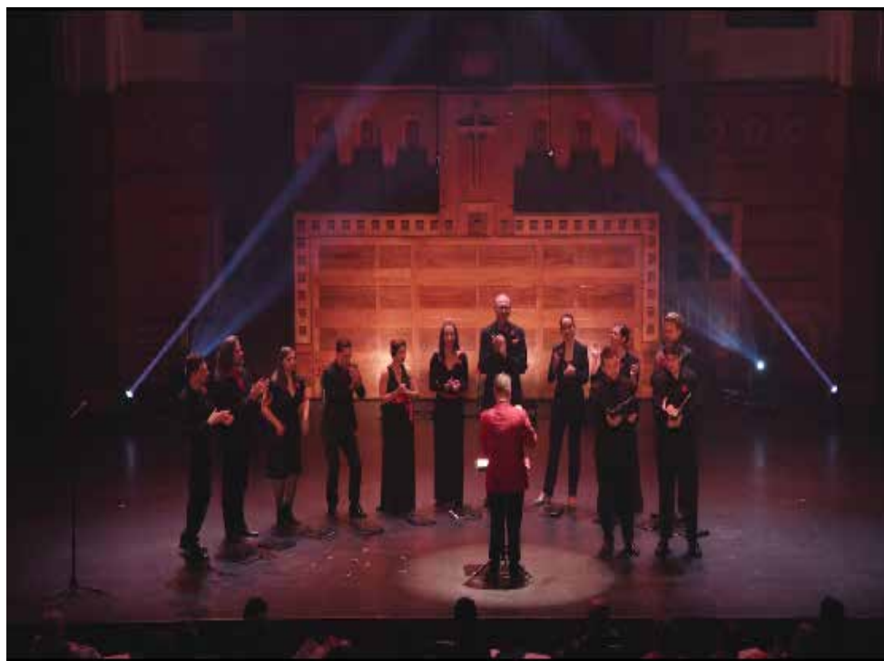
L'ensemble vocal Les Rugissants

Vous avez manqué ce spectacle? Il reviendra cet été dans le cadre des Concerts Lachine le 10 juillet prochain. À mettre à votre agenda. Ne manquez ce petit voyage éclair!