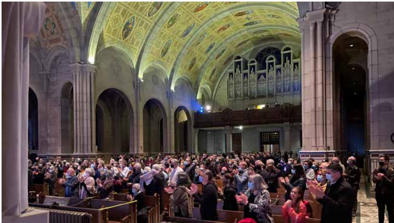
Un public très enthousiaste a souligné la prestation par un ovation debout.

Le chœur était absolument excellent. Une quarantaine de choristes professionnels disposés à un mètre de distance les uns des autres (selon les directives de l'époque) créait un effet de très gros chœur, très puissant, qui maîtrisait autant les fortissimos que les pianissimos , et réussissait à créer de magnifiques contrastes de nuances. Les accords finaux à la fin de chaque mouvement étaient particulièrement soignés. Le son était riche et plein, très équilibré entre chaque pupitre et très homogène au sein de chaque pupitre. On pourrait parler d'osmose du chœur à de nombreux moments du concert.