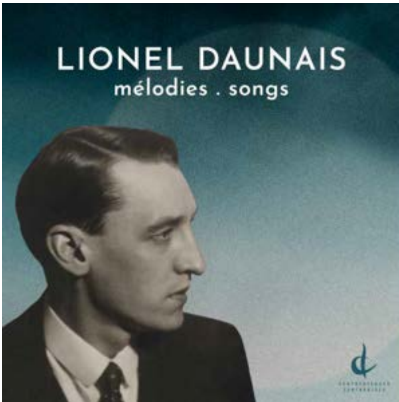
La couverture de l'album LIONEL DAUNAIS Mélodies . Songs