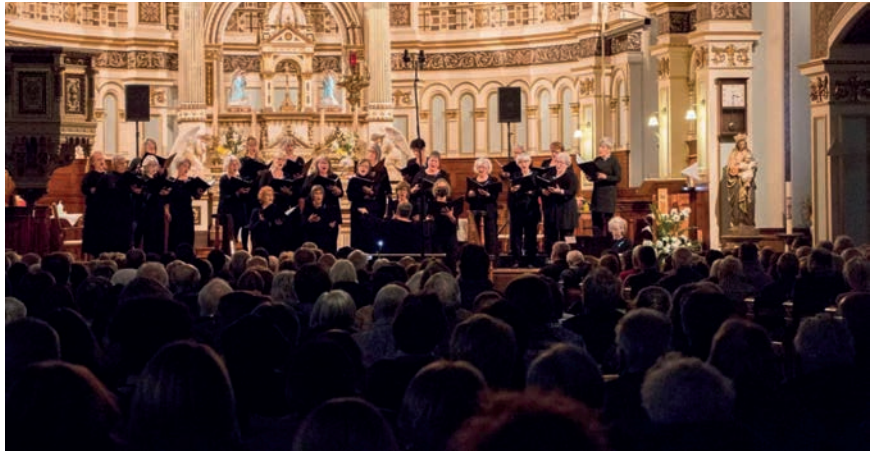
Les Chante-Dames en concert le 19 novembre 2023

Une première répétition avec tous les effectifs, chœurs et musiciens, aura lieu en septembre.