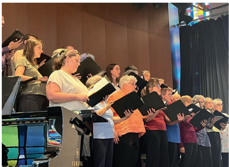
Les stagiaires ont pu compter sur un chœur témoin solide et motivé.