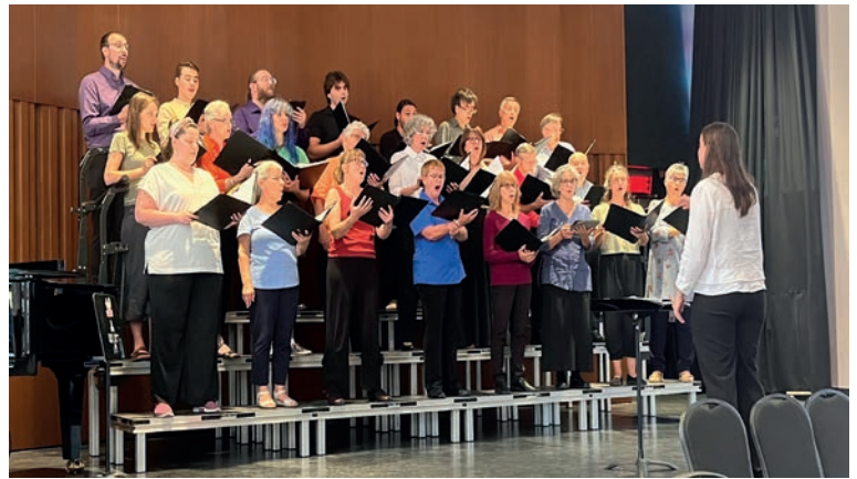
Les stagiaires ont l'occasion de diriger le chœur témoin pour mettre en pratique leurs apprentissages.

Ce fut à nouveau une magnifique expérience que cette semaine de formation. Nos stagiaires, provenant de la Côte-Nord, du Bas-Saint-Laurent, de l'Abitibi-Témiscamingue, de Niagara Falls, de la Montérégie et de Montréal, ont pu progresser à grande vitesse tout au long de la semaine et repartir dans leur coin de pays avec leur besace pleine de nouvelles connaissances qu'il et elles pourront utiliser tout au long de la nouvelle année et de leur carrière en direction.