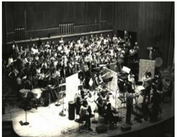
Enregistrement de La Petite suite québécoise en 1980.