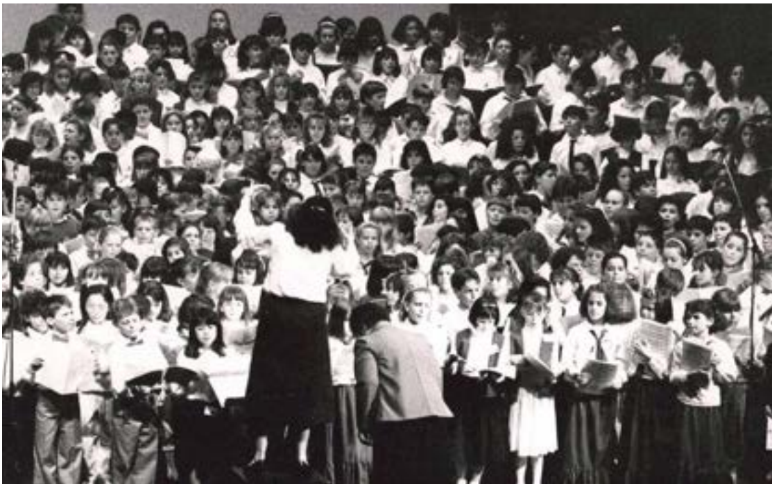
1989 - Chantons le mai Photo : Archives