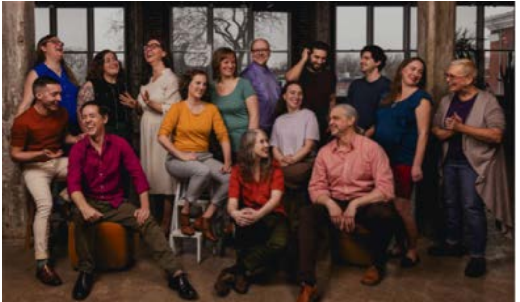
Le Studio de musique ancienne de Montréal en 2024.

Les œuvres de compositeurs comme Palestrina ou Victoria mettent particulièrement en valeur ces qualités. Les phrasés longs, soutenus par une maîtrise du souffle, nécessitent une respiration