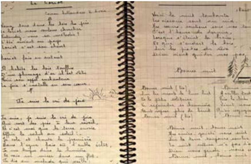
Photo des carnets de la mère de Françoise Davoine

Chanter, c'est simple, et ça ne coûte presque rien! Chanter en chœur, c'est la façon la plus facile de faire de la musique ensemble, c'est l'occasion de magnifiques découvertes musicales et de belles rencontres humaines. C'est faire danser les notes et vivre les mots avec une même passion, c'est respirer à l'unisson, c'est s'écouter les uns les autres, c'est vibrer à une seule et même source de bien-être! Qui dit mieux?