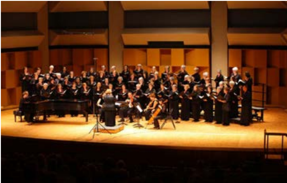
La Chorale du Gesù avec son invitée spéciale, la Chorale Beauséjour de Moncton en juin 2010 à la salle Pollack de l'Université McGill.

vocale, sur les spirituals, sur la musique Baroque, sur la musique liturgique orthodoxe, sans oublier les ateliers aux colloques des chefs de chœur et la chance de voir d'autres cheffes et chefs à l'œuvre aux Automnies et autres rassemblements comme les Chantons Noël.