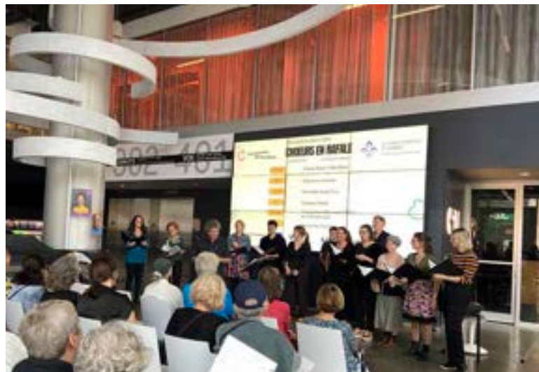
2024 - Journées de la culture - Choeurs en rafale - Ensemble choral VOX