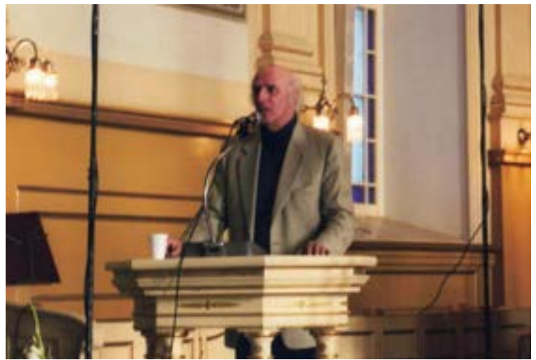
1999 - Automnie - Gilles Vigneault