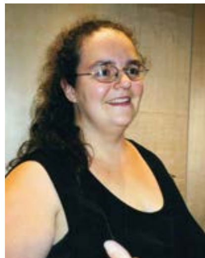
2001 - PFCC - Roxanne Croteau