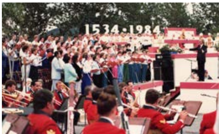
Les participants du Bateau chantant en concert lors d'une escale à Gaspé.