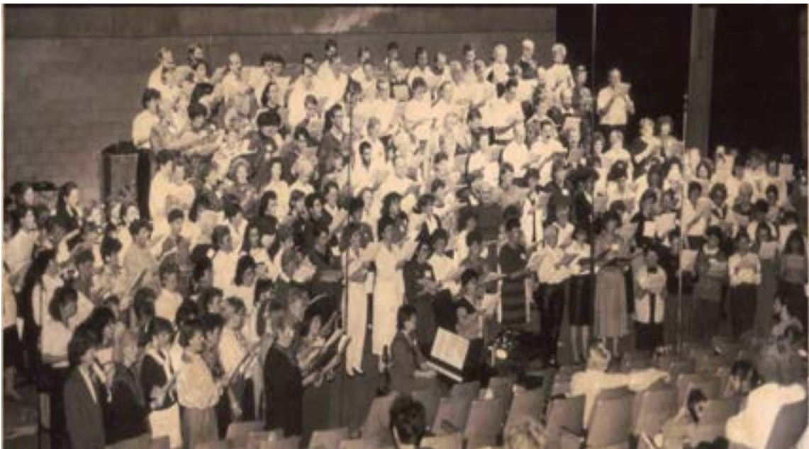
1989 - Automnie