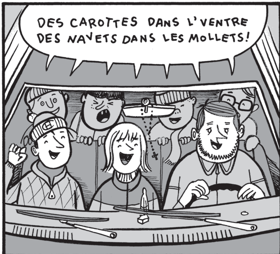
Une illustration de Michel Rabagliati, auteur de bandes dessinées.

Si je chante aujourd'hui, c'est parce que mon père chantait quasiment tout le temps. En revenant du travail, en bricolant, en cuisinant ses fameuses terrines. Il fredonnait des airs populaires et des chansons rigolotes de Maurice Chevalier, comme Prosper ou Ma pomme avec un fort accent parigot pour nous faire rire. J'adorais ça. Car si mon père chantait, c'était signe que tout se passait bien à la maison, dans sa vie d'homme, de travailleur et de père. Il sifflait superbement aussi, avec des trilles et des fioritures comme Roger Whittaker. Pour un enfant, entendre son père ou sa mère chanter dans la bonne humeur est extrêmement rassurant. J'ai donc reçu par lui l'envie de chanter et de m'exprimer un peu par la musique, même si je ne suis qu'un musicien amateur.