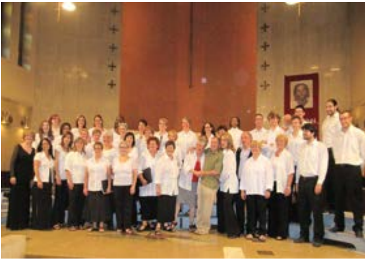
2011 - PFCC - Choeur témoin