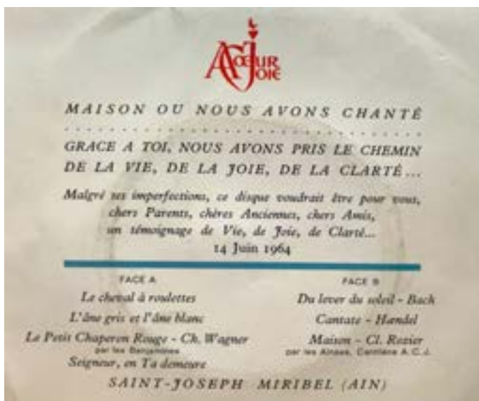
Pochette du mini 33 tours

Pas étonnant donc que j'aie éprouvé tant de plaisir à animer pendant plusieurs années l'émission De tout chœur avec vous à l'antenne d'Ici musique, la radio musicale de Radio-Canada. Quelle joie de faire découvrir tant de répertoire et tant d'ensembles remarquables d'ici et d'ailleurs, professionnels ou amateurs! Quelle joie aussi de constater à quel point la richesse du chant choral est infinie, et à quel point la vie chorale québécoise en témoigne!