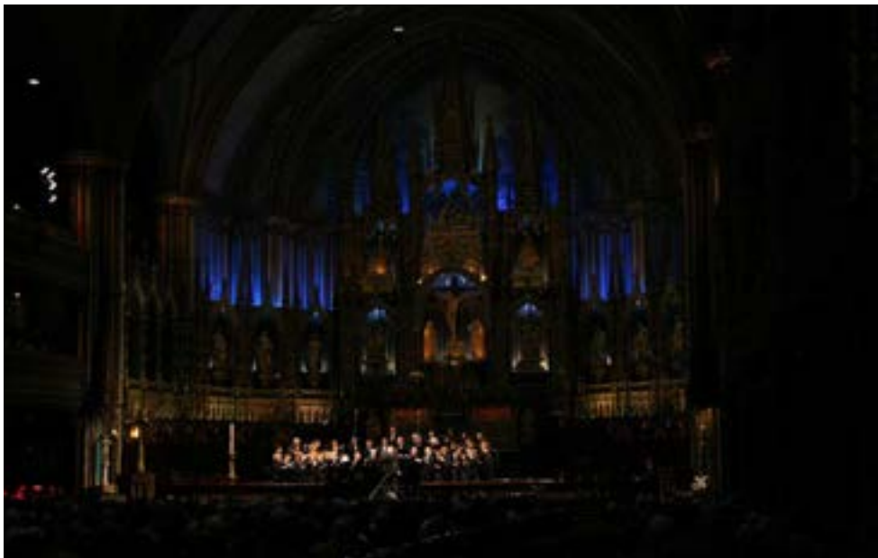
Festival choral de musique religieuse de Montréal en 2004 à la basilique Notre-Dame.

3. Durant la soirée, l'œuvre principale au programme était le Requiem de Mozart accompagné par un orchestre professionnel. 5