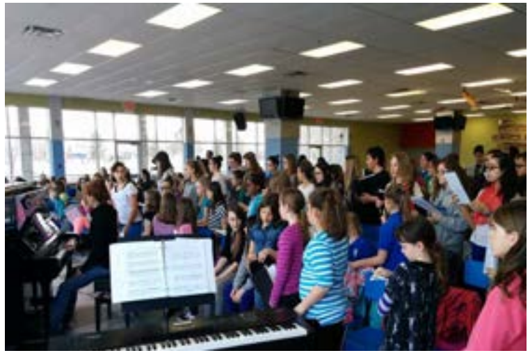
2015 - Chorissimo - chants communs