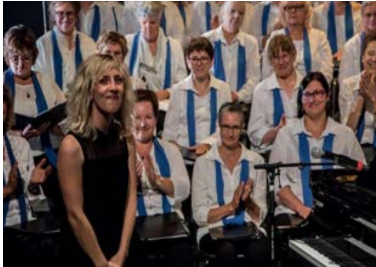
2018 - Le Québec chante 2018 avec Ingrid St-Pierre à La Tohu