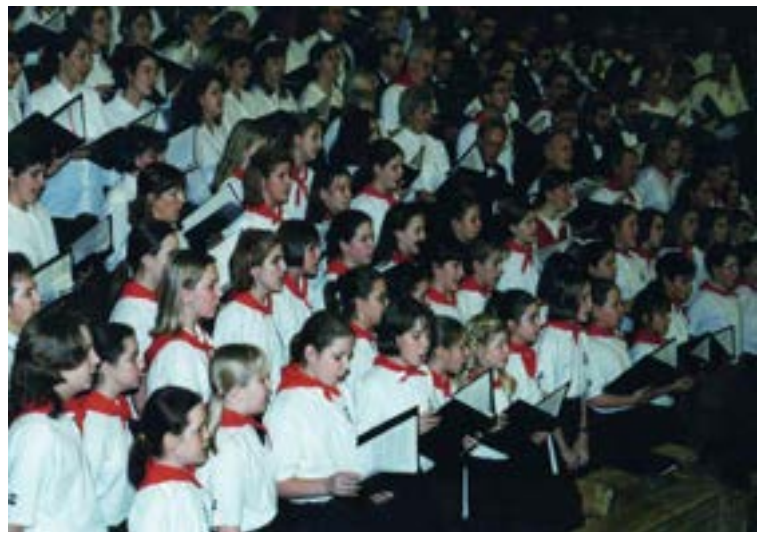
1996 - Chantons Noël - Région de Québec