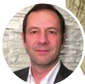
PAR FRÉDÉRIC SEGRETINAT DIRECTEUR COMMERCIAL INTERNATIONAL B2B