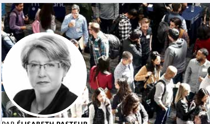
PAR ÉLISABETH PASTEUR COACH PROFESSIONNEL, COORDINATRICE DE LA COMMISSION