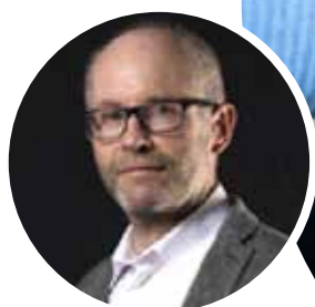
PAR PHILIPPE GRAMOND DIRIGEANT ASSOCIÉ DE CYCONIA