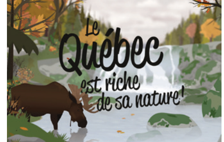
Les services écologiques rendus par nos espèces et leurs habitats