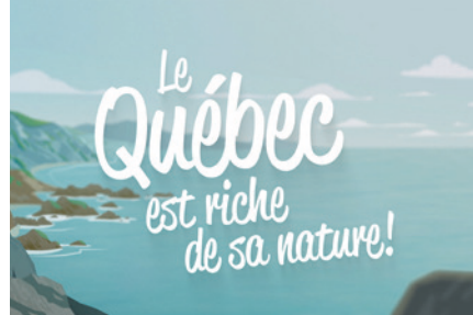
Les habitats fauniques