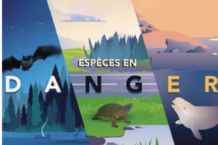
Les espèces menacées ou vulnérables