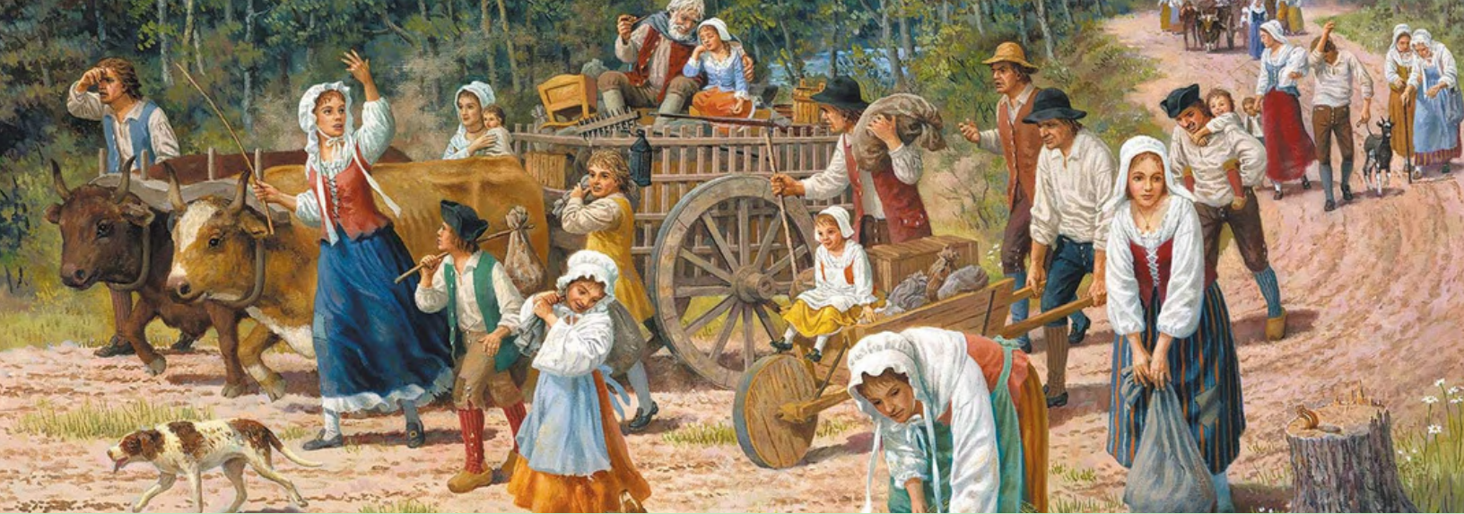
Illustration : Série: Déportation des Acadiens, Lieu historique de Grand-Pré de l'artiste Claude Picard – Gracieuseté Parcs Canada