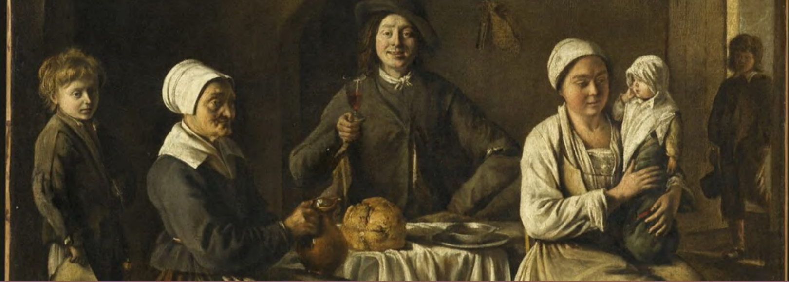
Photo : La Famille heureuse.