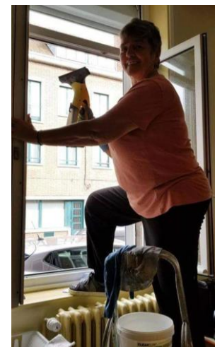
Lavage de vitres

«AIDER PLUS PAR AMOUR QUE PAR DEVOIR ET SERVICE SANS DOMINER »