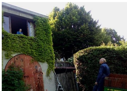
Voreppe: soeur de l'Annonciation

Service Amitié termine l'année 2021 en bonne situation financière malgré la pandémie qui a réduit considérablement les recettes.