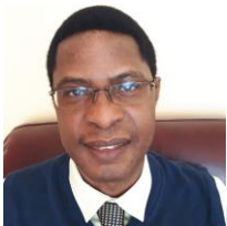
Par Père Philippe Zilaya, M.S.A.