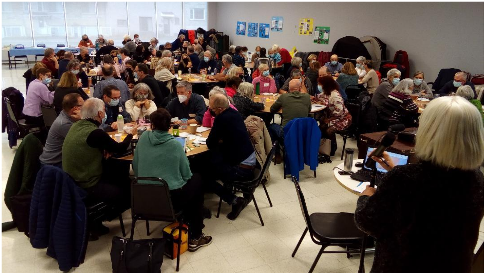
Journée de formation à Montréal

Pour terminer, j'aimerais remercier personnellement tous les participants et toute l'équipe responsable de la formation pour le travail accompli. Cette journée est une réussite grâce à tout ce beau monde.