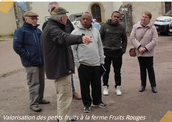
Valorisation des petits fruits à la ferme Fruits Rouges