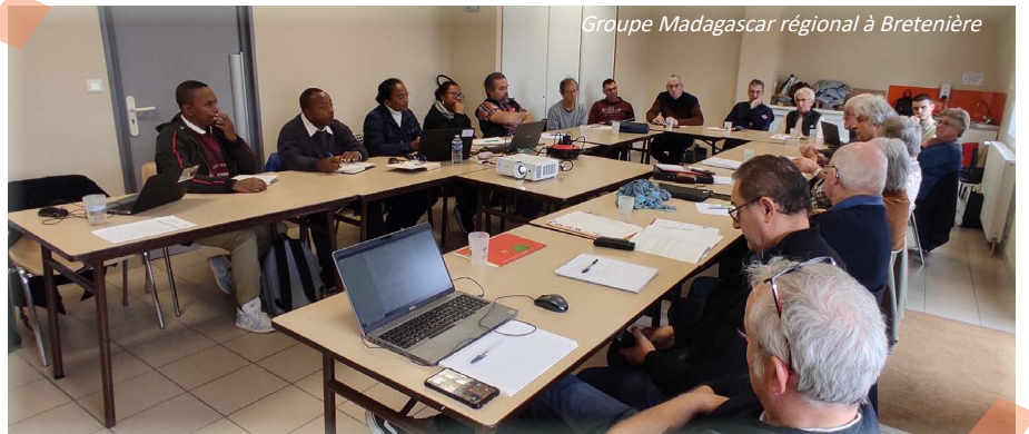
Groupe Madagascar régional à Bretenière