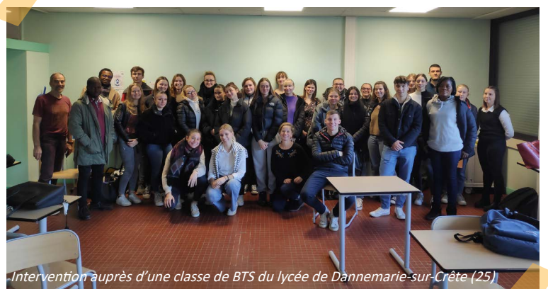
Intervention auprès d'une classe de BTS du lycée de Dannemarie-sur-Crête (25)

Une première mission en France très riche (et fort intense) grâce à laquelle ils ont contribué à un peu plus d'ouverture au monde chez les jeunes. Un grand bravo à eux et merci encore aux bénévoles qui les ont accueillis et accompagnés en BFC.