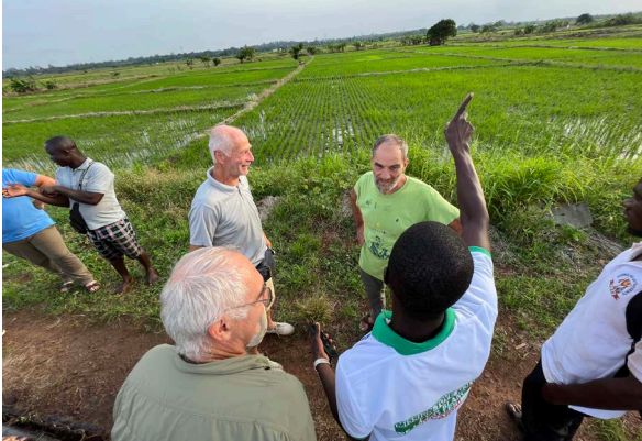
Discussion autour de la riziculture togolaise

« Cette mission au Togo (du 1er au 11 octobre) m'a permis de connaître l'association Afdi de part mon mandat d'administrateur au sein des Jeunes Agriculteurs de Saône-et-Loire. Eprouvant un réel intérêt de connaître l'agriculture d'ailleurs, la participation à cette mission et à l'engagement Afdi était pour ma part une évidence. Concernant le voyage, j'ai pu apprécier des rencontres humaines avec les différents acteurs de l'agriculture togolaise, qui de part la qualité des échanges et du partage de connaissance ont été fondamentales dans l'expérience humaine vécue sur place.