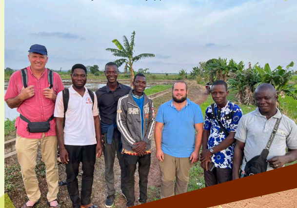
Rencontre avec des jeunes du Rejeppat

J'ai eu l'occasion d'apprendre énormément sur l'agriculture togolaise durant cette mission mais il en reste encore tellement à découvrir. J'ai été ravi de partager cette mission avec mes collègues de Saône-et-Loire mais aussi du Doubs. »