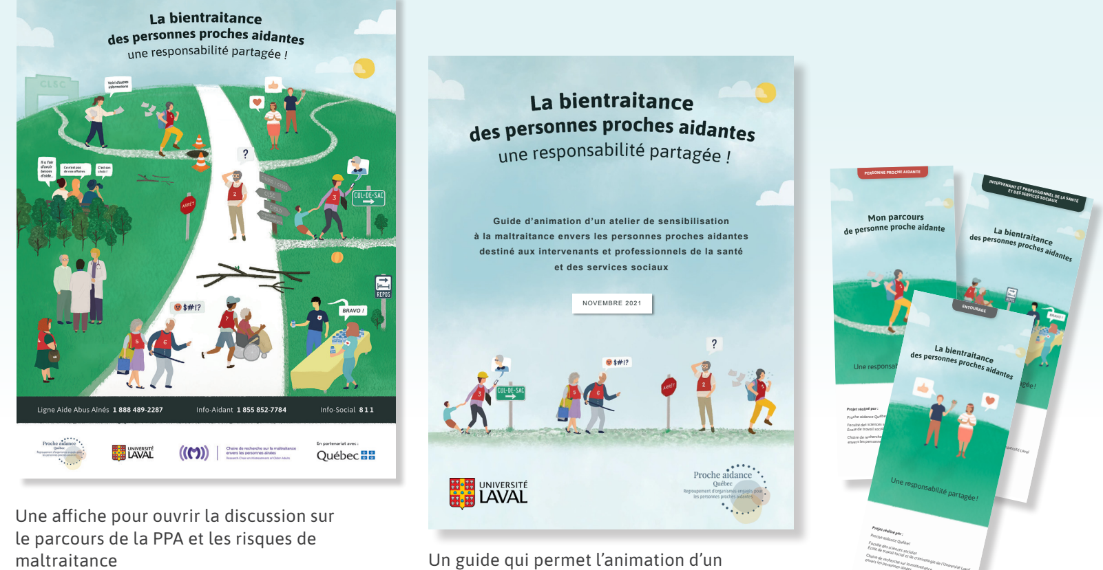
Une affiche pour ouvrir la discussion sur le parcours de la PPA et les risques de maltraitance.