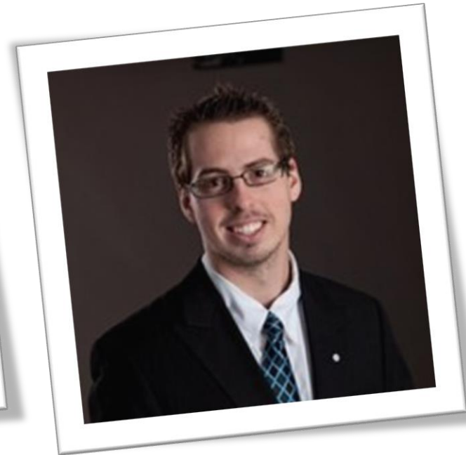
Yannick Guérin Les jardins A. Guérin et fils JAG