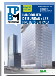
Immobilier de bureau : les projets en Paca 2 novembre 2022