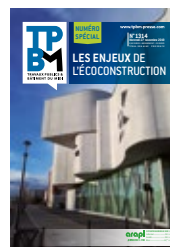
Les enjeux de l'écoconstruction 30 mars 2022

Rencontres privilégiées pour créer du lien, réfléchir ensemble sur des sujets d'actualité propres à chaque territoire et mettre en avant les bonnes pratiques