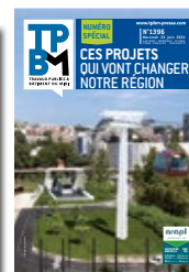
Aménagement : les grands projets Paca 22 juin 2022