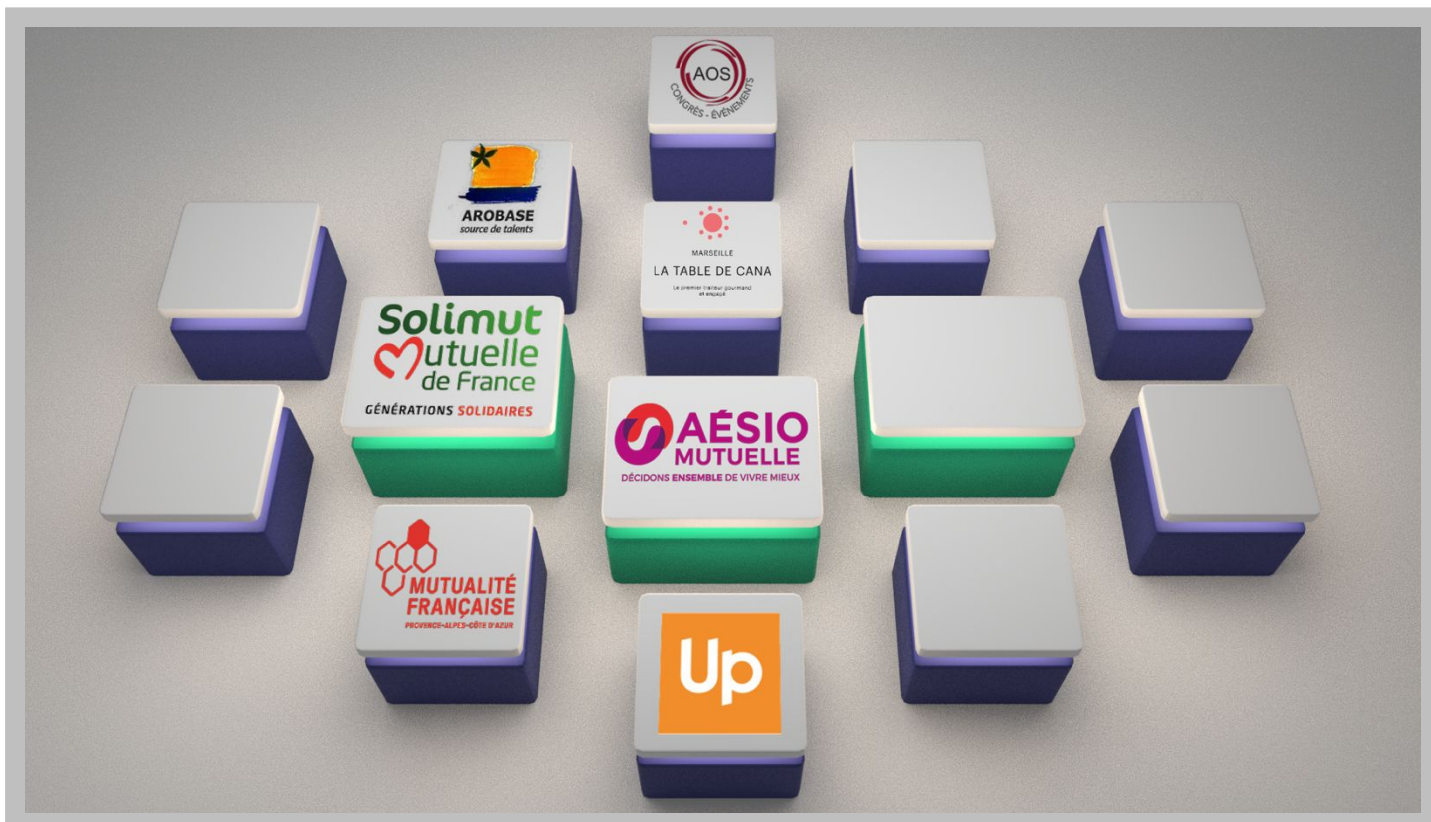
Exemple espace exposition

Ce sera comme si vous y étiez ! Semblable à l'espace d'exposition, un espace virtuel sera aménagé. Les exposants seront répartis dans cet espace.